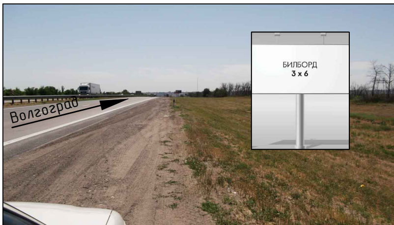
Фотография места предполагаемого размещения рекламной конструкции