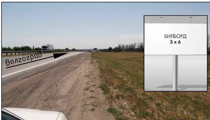
Фотография места предполагаемого размещения рекламной конструкции