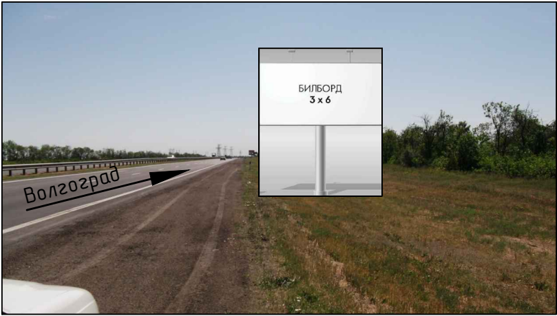
Фотография места предполагаемого размещения рекламной конструкции