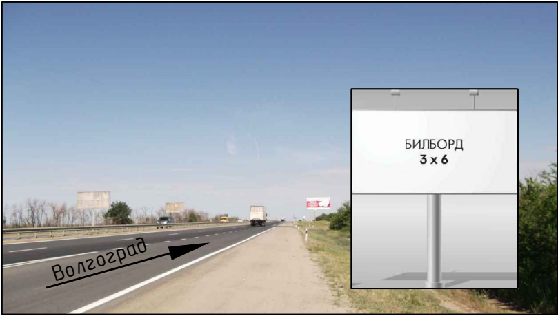
Фотография места предполагаемого размещения рекламной конструкции