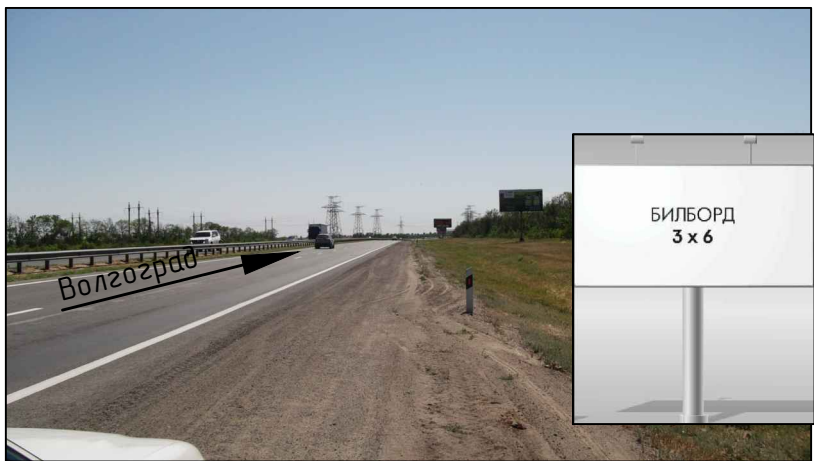
Фотография места предполагаемого размещения рекламной конструкции