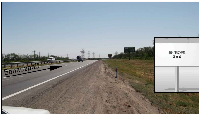
Фотография места предполагаемого размещения рекламной конструкции